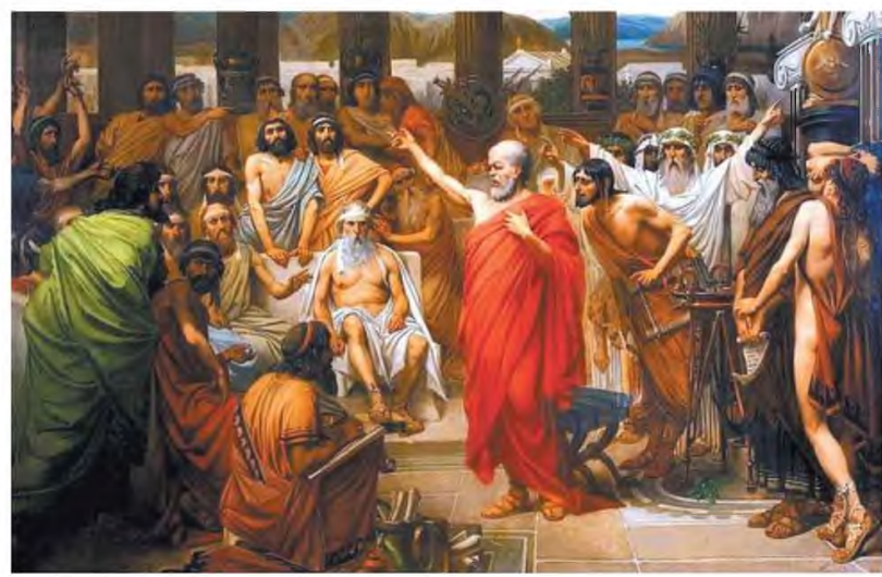
Ο Σωκράτης αγοράζει. Έργο του Βέλγου ζωγράφου Λουί Ζοζέφ Λεμπρόν (1867)

Κάποιες ιδέες, μας λέει ο συγγραφέας, δεν εννοούν να εκπνεύουν, παρότι ο ανορθολογισμός τους καταδεικνύεται απειλημένους. Αν όμως ο γνωσιολογικός σχετικισμός και η ρευστότητα έχουν αναρρηθεί ήδη, χιλιάδες χρόνια τώρα, πώς γίνεται να επιμένουν και να είναι τόσο δημοφιλή στις μέρες μας; Η απάντηση στο ερώτημα αυτό θ' απαιτούσε μάλλον πολύ περισσότερη ανάλυση απ' όση επι- τρέπει ο χώρος.