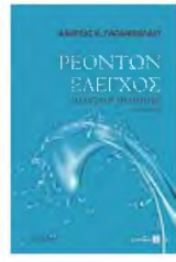
Ανδρέας Κ. Παπανικολάου PEONTON EΛEΓXOS ΠΛΑΤΩΝΟΣ ΘΕΑΙΠΠΟΣ (151D-183C) Εκδ. Τόπος, 2022, σελ. 175 Τιμή 12 ευρώ

Ο έτερος συνομιλητής του Σωκράτη, ο Θεόδωρος, ηλικιακά προεπιβλητός, διανοητικά ωριμότερος και παλιός φίλος και συνοδοιπόρος του Πρωταγόρα, επίσης συζητά με τον Σωκράτη και επιχειρεί να ελέγξει τα επιχειρήματά του, με την αυθεντία που του δίνει η εμπειρία του καθώς και η προσωπική γνώριμά που είχε κάποτε με τον κορυφαίο σοφιστή.